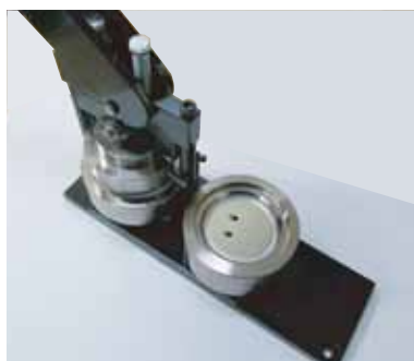
③ の型に下パーツを入れます