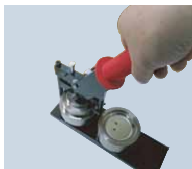
レバーを下げてください