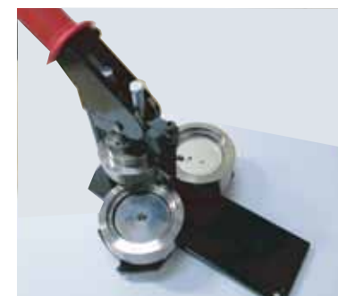
レバーを上げて回転します