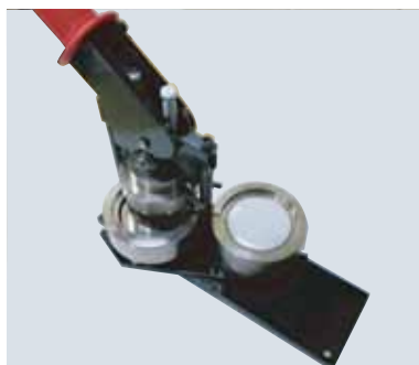
レバーを上げて回転します