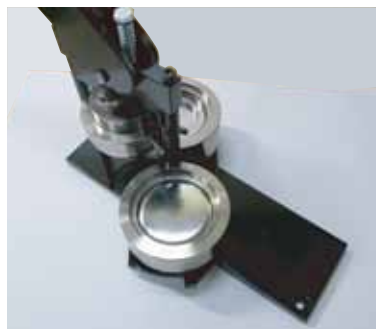
② の型に上パーツを入れます