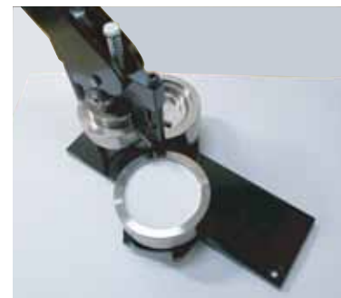
次に印刷紙を入れます