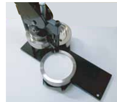
次にフィルムを入れます