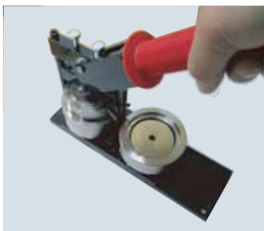
レバーを下げてください