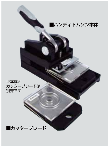
■ハンディトムソン本体