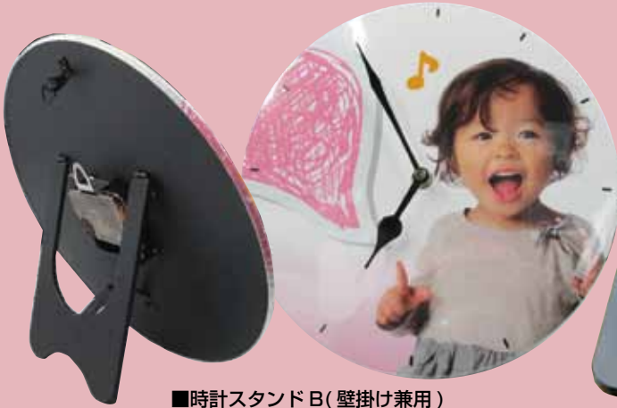
■時計スタンド B(壁掛け兼用)