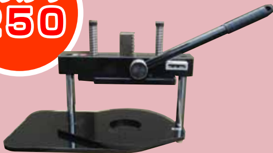
■サイズ(mm) : L510×W300×H345(レバー除く) ※アタッチメント 158、250 が取付可能です