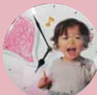
■時計スタンド B(壁掛け兼用)