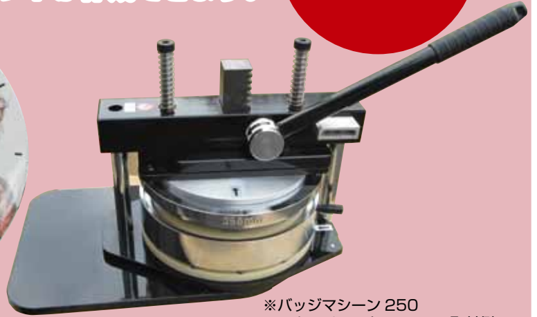
※バッジマシン 250 アタッチメント 250mm 取付例