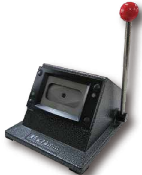
スタンドカッター

長方形 (大) 品番：SC-REL 長方形 (小) 品番：SC-RES 長方形 品番：SC-REC