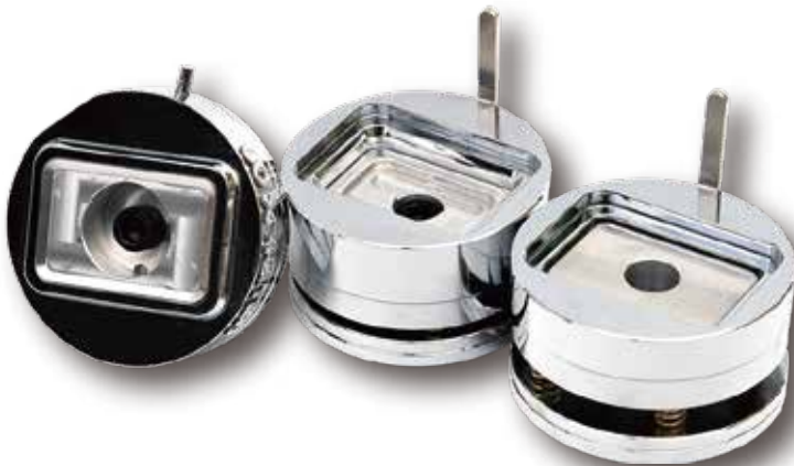
長方形 (大) 角型 (長方形)